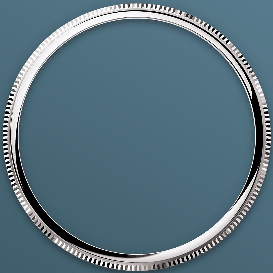
圆拱形及三角坑纹外圈